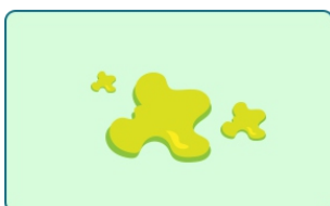
Catarro e secreções